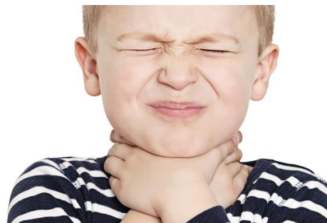
Бол у грлу