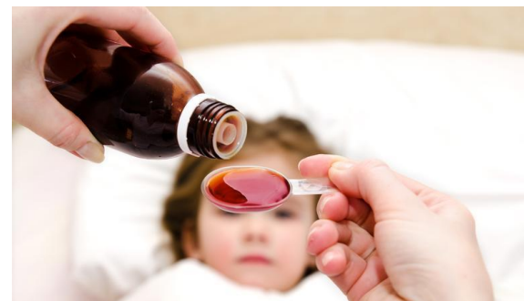
Употреба антибиотика, сирупа