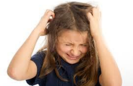
Вашке и гњиде